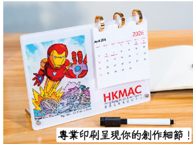
專業印刷呈現你的創作細節!

截止報名日期: 2025年11月18日 頒獎禮日期: 2025年12月21日 頒獎禮地點: Paragon 有利中心 4樓, 觀塘 現場設有得獎者作品展示