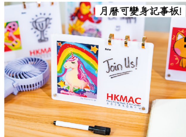
月曆可變身記事板！

評審團主席 統籌評審流程，確保公平、公正、專業 Andreas von Buddenbrock (The Ink Trail) 瑞典藝術家與插畫家，居於香港。著有《The Ink Trail: Hong Kong》(Blacksmith Books, 2024) 評審準則：技法與技巧、色彩運用、構圖與結構、創意與表達、整體完成度