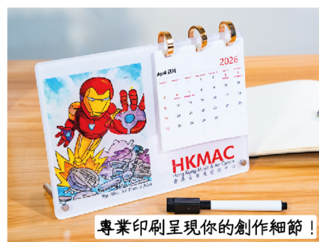
專業印刷呈現你的創作細節！

參賽費用：$180 接受實體畫作及電腦繪圖 參賽費用已包括： 1. 你設計的月曆 2. 獎狀或參與證書